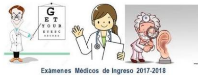
Exámenes Médicos de Ingreso 2017-2018